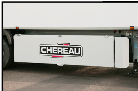
Vista frontal con el tronco cerrado