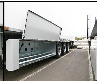
Vista frontal con el maletero abierto