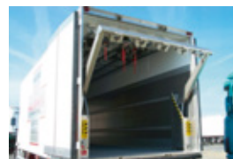
LEVIAND 120 en inox 5 sorties