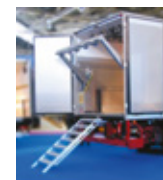
LEVIAND 60 en inox 4 sorties