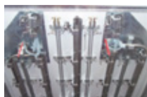
5 tubes avec aiguillage / 4 birails