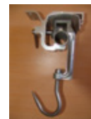
Crochet diabolo tube 40/49