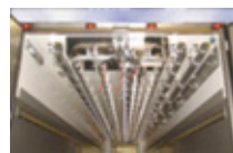
5 tubes / 4 birails avec aiguillage