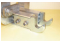
Embouts de raccordement