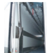
½ LEVIAND 25 2 sorties