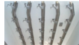
5 tubes 50/60 mm convergents sur potence de 140 mm