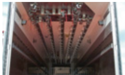
Aiguillage 5 tubes / 2 sorties