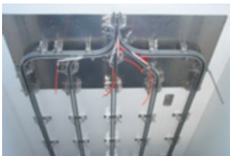
Aiguillage de sortie central