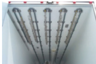
Glissières « FURGO CAR » avec retours