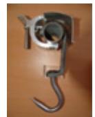
Crochet DIN 250 tube 50/60