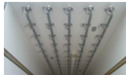
5 tubes 40/49 mm en inox convergents sur potence de 110 mm